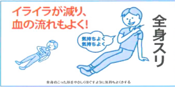
参考にした本: 軽と体の流れをよって健康になる 決定版 ゆる体操 (富田美実著 財研研究社刊)